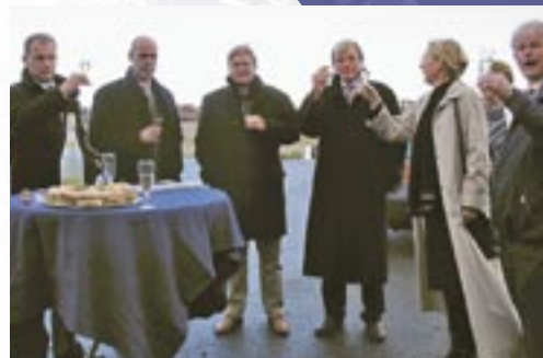
— Proosten op een succesvolle toekomst op HoogTij!